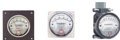
encastré ...en saillie...ou sur conduite

Montage. Boîtier de taille unique. Ø de perçage 115mm. Le magnehelic peut être monté encastré ou en surface en utilisant le kit de montage fourni.